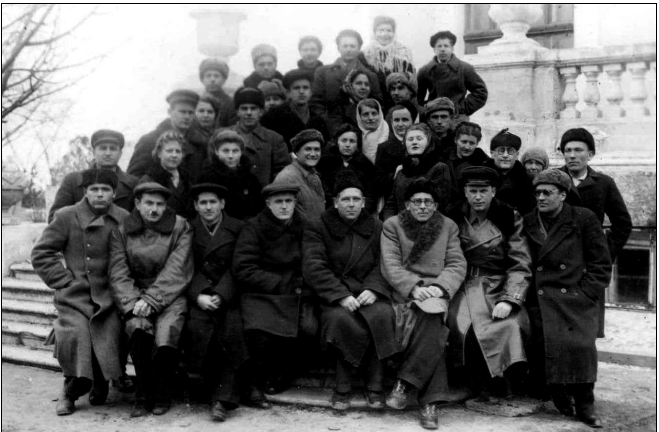
Республіканські курси підвищення кваліфікації агрономів-виноградарів 1955 р.