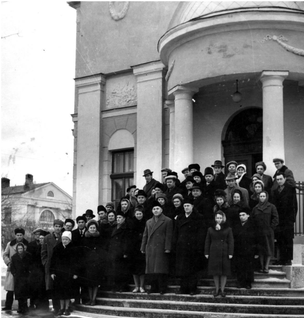
Учасники звітної сесії вченої ради, лютий 1962 р.