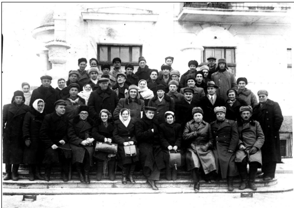
Республіканські курси підвищення кваліфікації агрономів-виноградарів 1954 р.