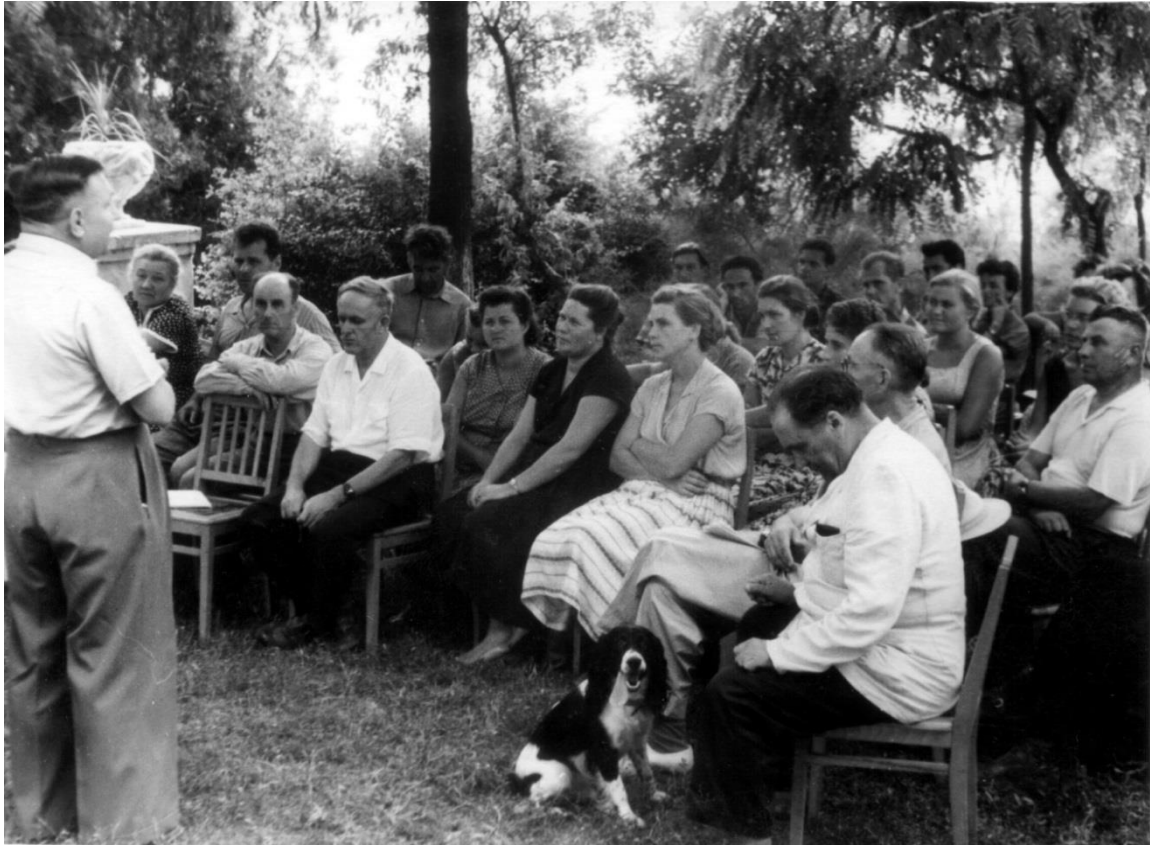
Засідання вченої ради біля будівлі інституту