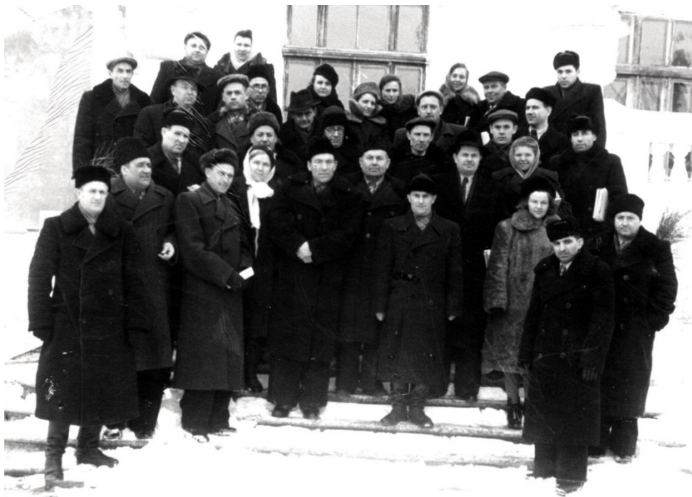
На сходах рідного інституту