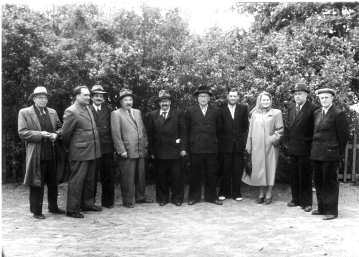
В оточенні колег у п'ятидесяті роки