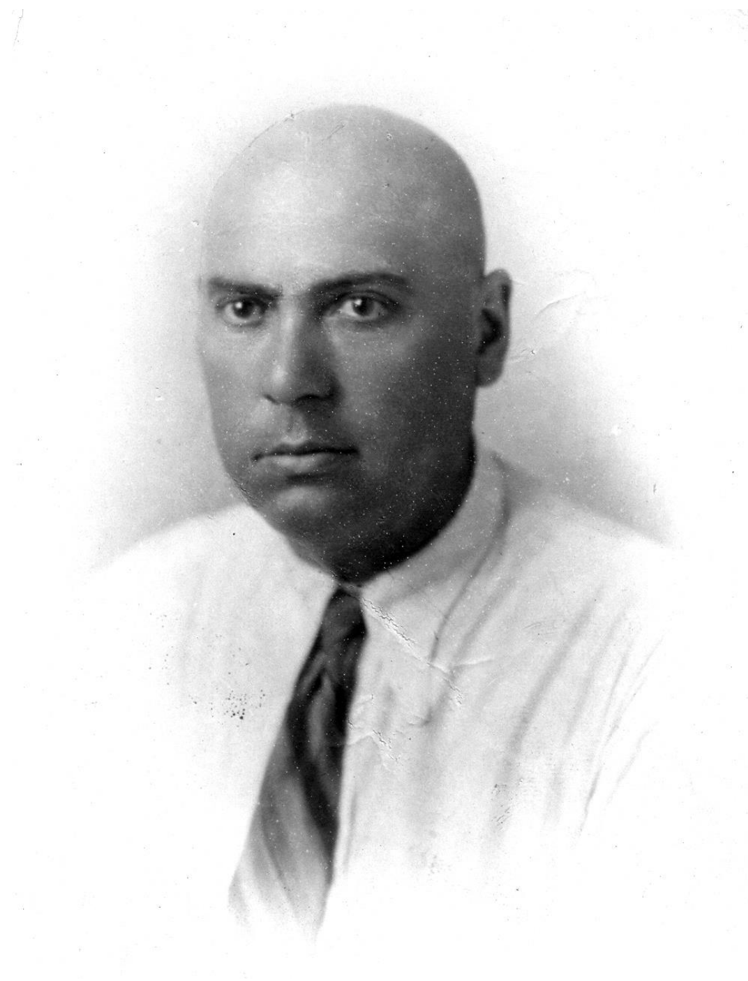
Мельник Сергій Олексійович (1898–1968)