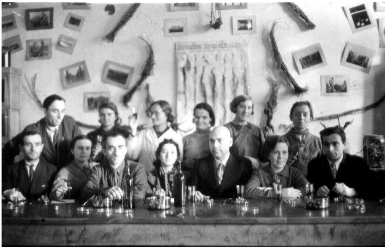
На засіданні кафедри в Одеському сільськогосподарському інституті